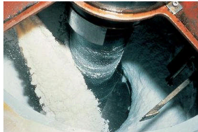
La centrifugeuse sépare les cristaux de sucre et la mélasse.

De très petits cristaux de sucre sont ajoutés au sirop. En même temps, on retire encore de l'eau pour que les cristaux puissent grandir. Les cristaux sont séparés du sirop (mélasse) dans des centrifugeuses et lavés brièvement.