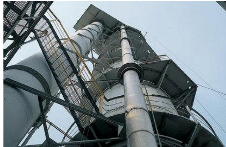
Purification du jus

L'adjonction de lait de chaux et de gaz carbonique permet de précipiter la matière sèche non sucrée. La chaux et les résidus sont utilisés comme engrais.